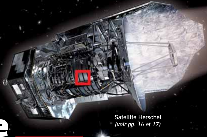
Satellite Herschel (voir pp. 16 et 17)

CONTEXTE Notre œil ne perçoit qu'une partie de la lumière. Lorsque l'on observe le ciel avec des télescopes optiques, certaines régions des galaxies apparaissent vides... Elles sont pourtant remplies de gaz et de poussières interstellaires, perceptibles dans la gamme des infrarouges.