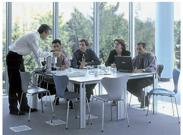
1 Une revue de projet